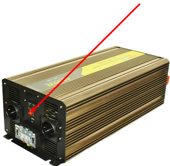
obr. č. 1 – přepínač v poloze O = vypnuto